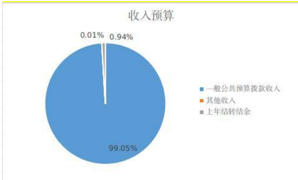
图 1: 收入预算