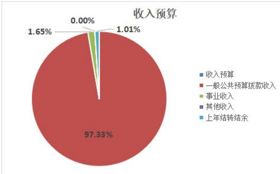
图 1: 收入预算